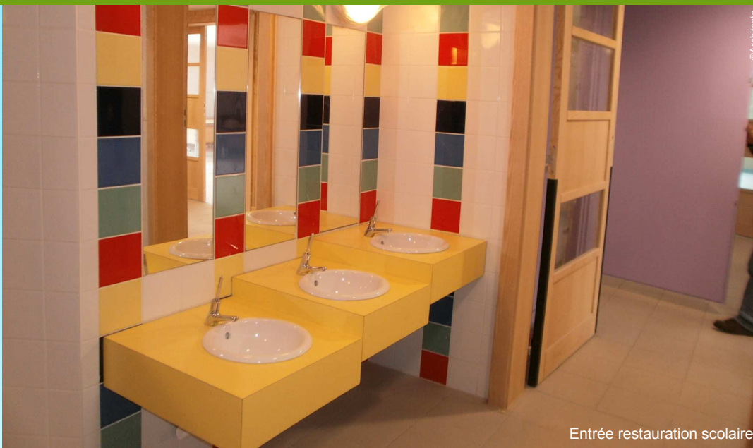
Entrée restauration scolaire