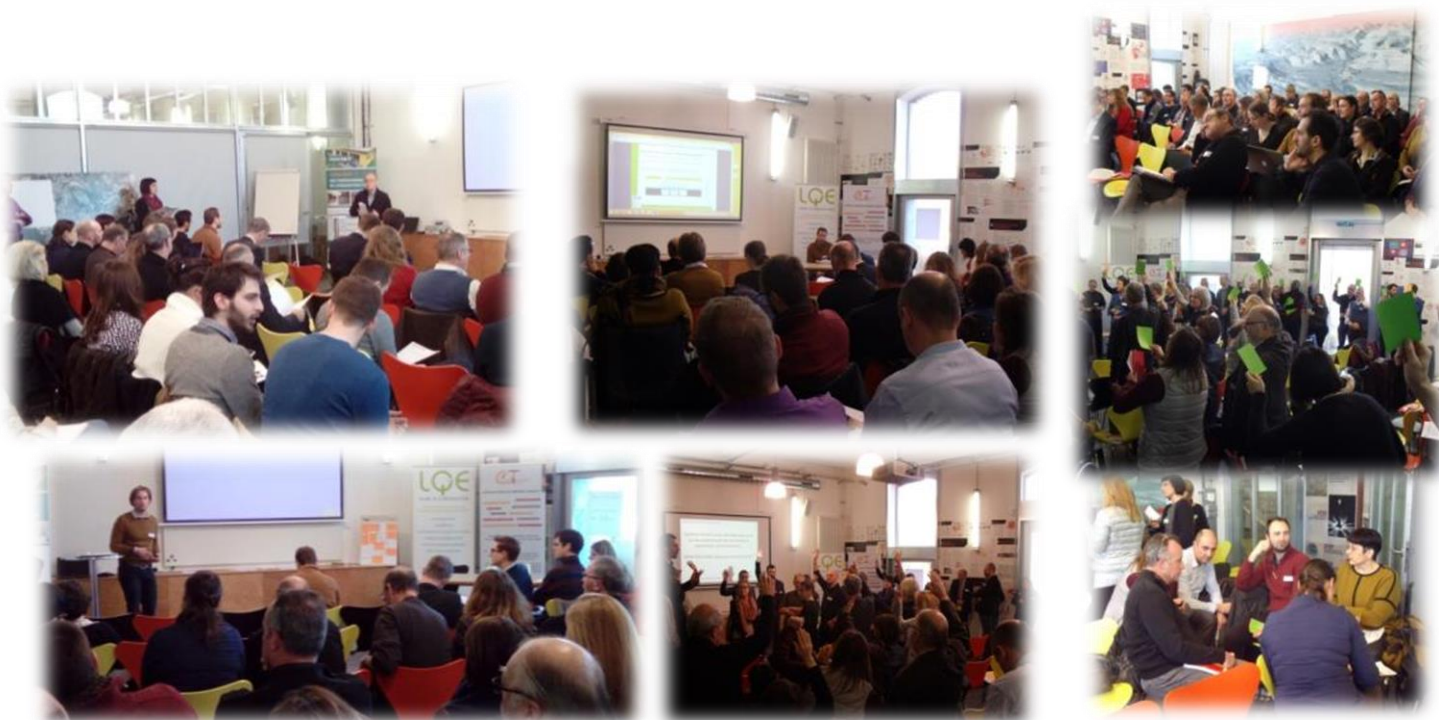
Manifestation accueillie par l'Aduan

Voici une brève synthèse des échanges de la journée.