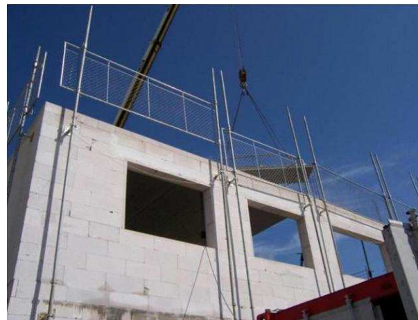
5 bis Rue Alfred Kastler