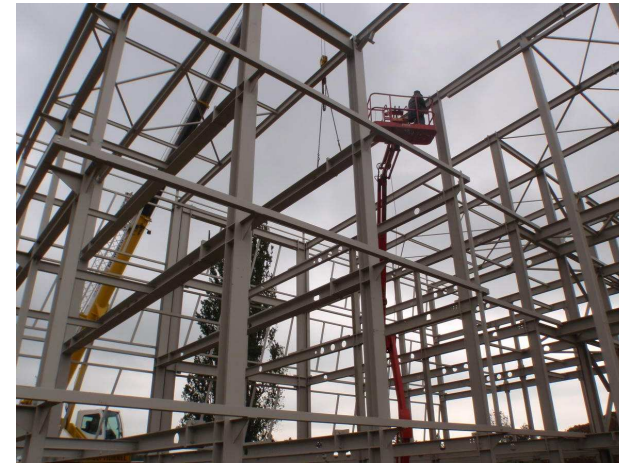
15 rue de sarre