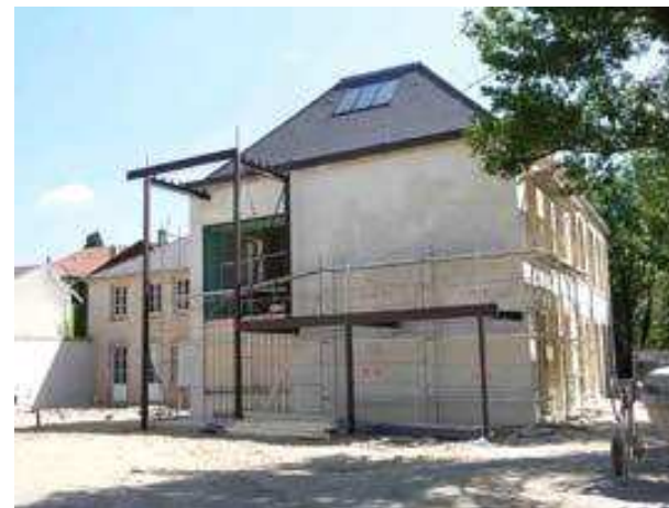
2 Rue Jeanne d'Arc