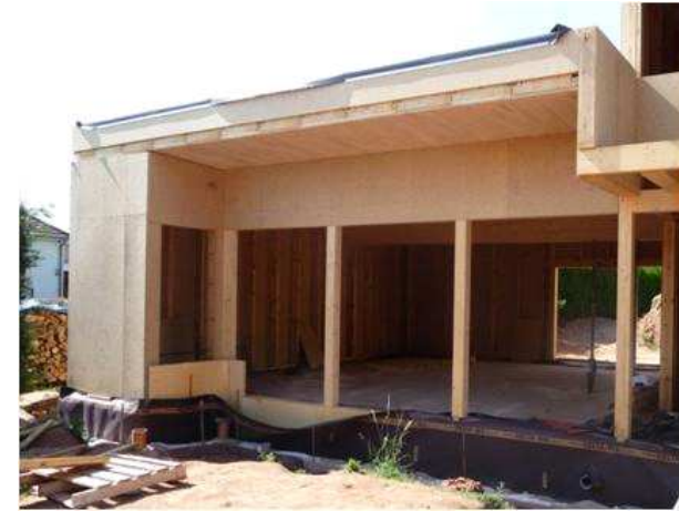
25, rue de la Croix