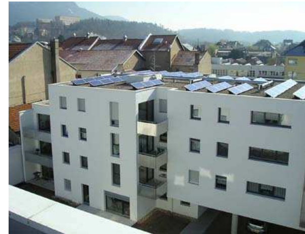
Rue de la prairie